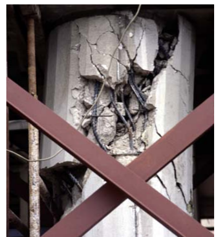
Φωτ. 6 (αρ.): Διατμητική αστοχία υποστυλώματος πάνω & κάτω με λυγισμό ράβδων και θραύση λεπτών & αραιών συνδετήρων Φωτ. 7,8 (μέσο & δεξ.): Διατμητική αστοχία υποστυλώματος με λυγισμό ράβδων και θραύση λεπτών & αραιών συνδετήρων