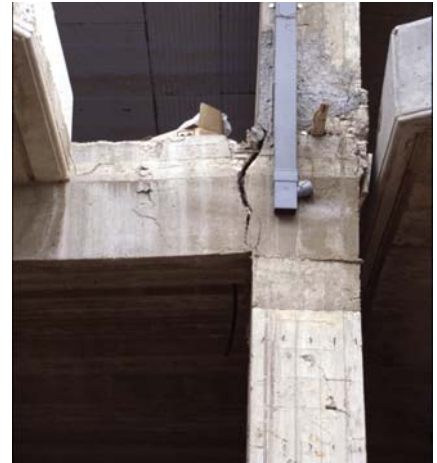
Φωτ. 1 (αρ.): Αποφλοίωση σκυροδέματος επικάλυψης Φωτ. 2,3 (μέσο & δεξ.): Ανεπαρκής αγκύρωση πάνω & κάτω ράβδων δοκού