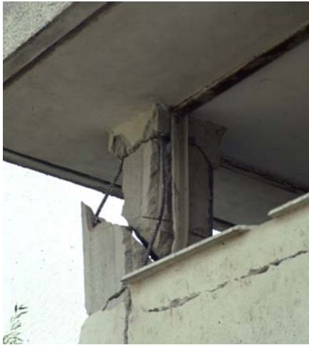
Φωτ. 15 (αρ.): Αστοχία κοντού υποστυλώματος