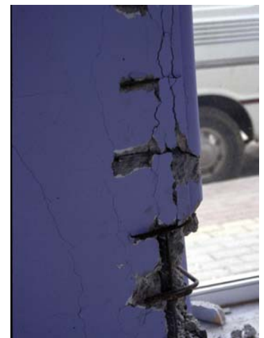
Φωτ. 12,13 (αρ. & μέσο): Άνοιγμα συνδετήρων με κάμψη άκρων κατά 90° μετά την αποφλοίωση της επικάλυψης των οπλισμών Φωτ. 14 (δεξ.): Εκτίναξη γωνίας διατομής σκυροδέματος λόγω μη συγκράτησης του κατακόρυφου οπλισμού στη γωνία συνδετήρα