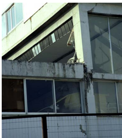
Φωτ. 23 (αρ.): Αστοχία κόμβου και απώλεια περίσφιγξης συνδετήρων λόγω τοποθέτησης υδρορροής εντός του υποστυλώματος