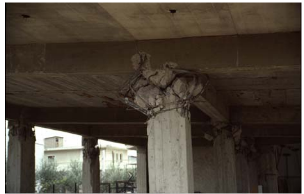
Φωτ. 10,11 (αρ. & δεξ.): Διατμητική αστοχία πάνω άκρου υποστυλωμάτων λόγω απουσίας συνδετήρων. Ο μανδύας συνδετήρων έφτανε μέχρι 0.50 m κάτω από τις δοκούς