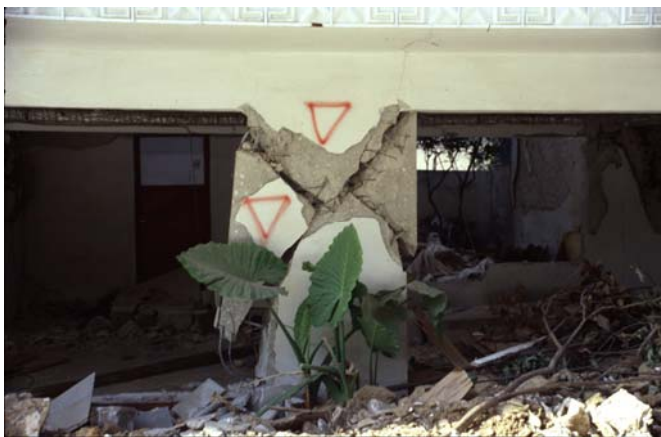
Φωτ. 19 (αρ.): Διατμητική αστοχία τοιχώματος με μεγάλες παραμορφώσεις