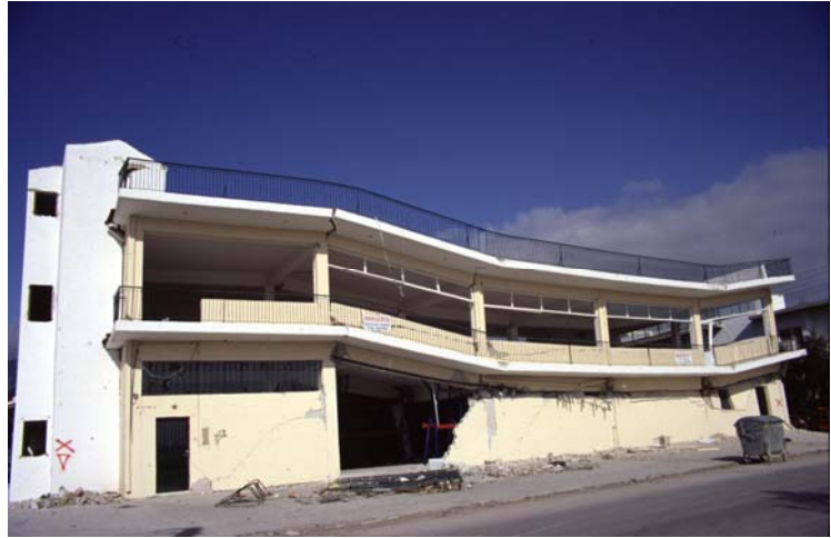
Φωτ. 16 (δεξ.): Αστοχία σειράς κοντών υποστυλωμάτων