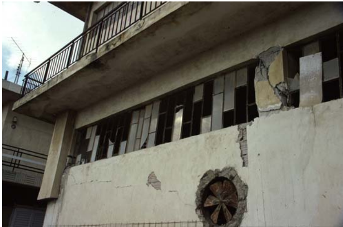
Φωτ. 17 (αρ.): Αποτελεσματικότητα επισκευής με τοπικό μανδύα κοντού υποστυλώματος βλαμμένου από προηγούμενο σεισμό