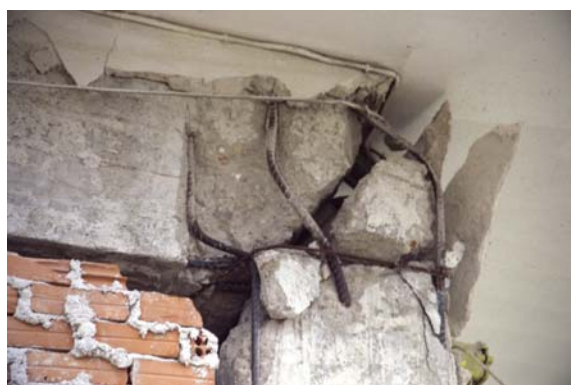
Φωτ. 21 (αρ.): Αστοχία εξωτερικού κόμβου με μείωση ακαμψίας του